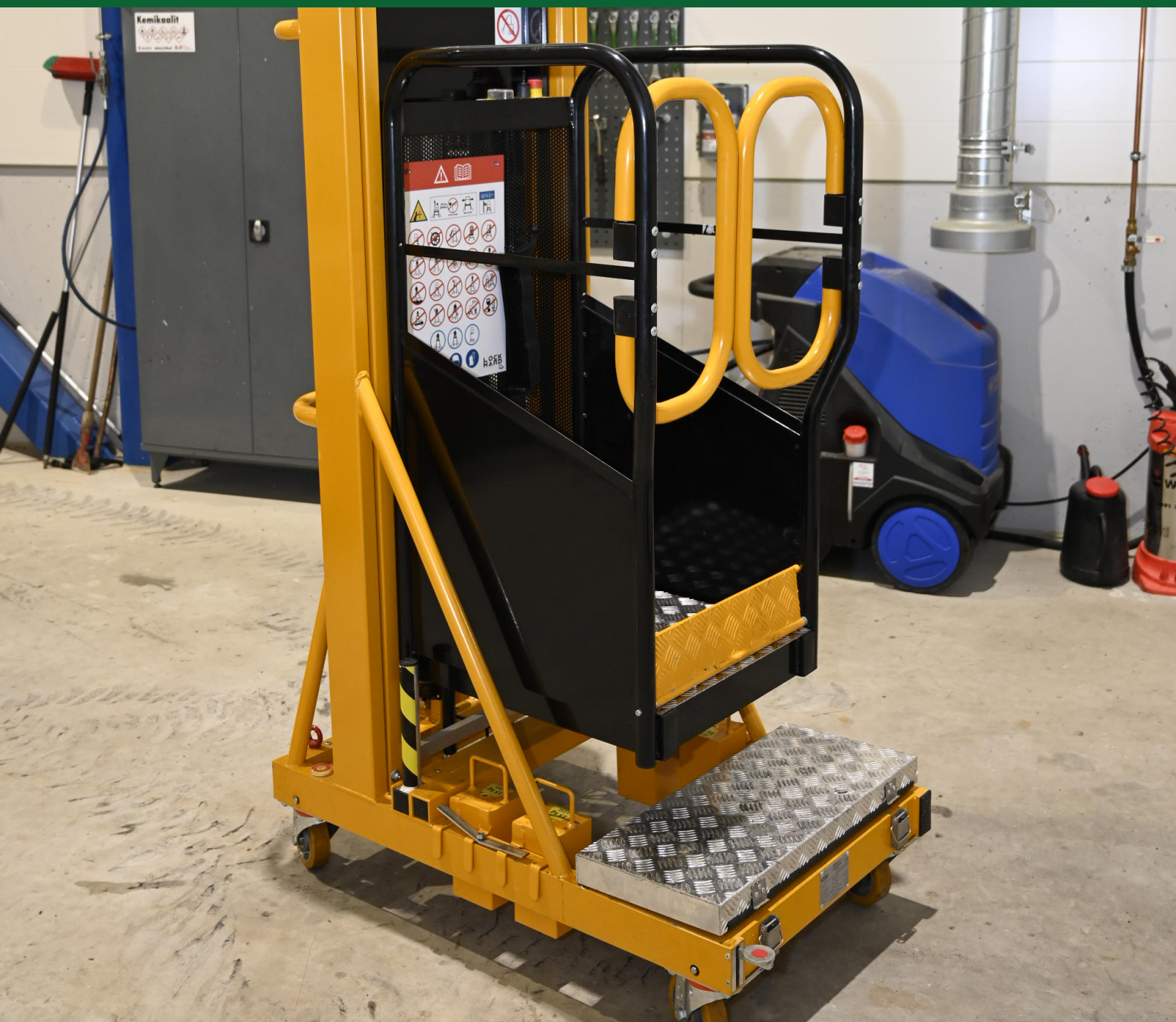
Ixolift 400-WS B FI