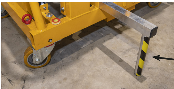
Uudet tukijalat Uplift 5HD mallissa

*Uplift5HD- mallissa on mekaanisesti lukkiutuvat, kulutusta kestävät renkaat.